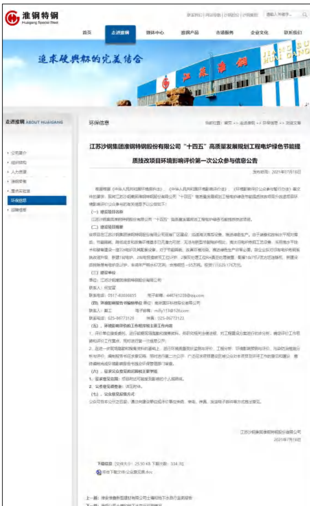
图 2.2-1 第一次网络公示截图