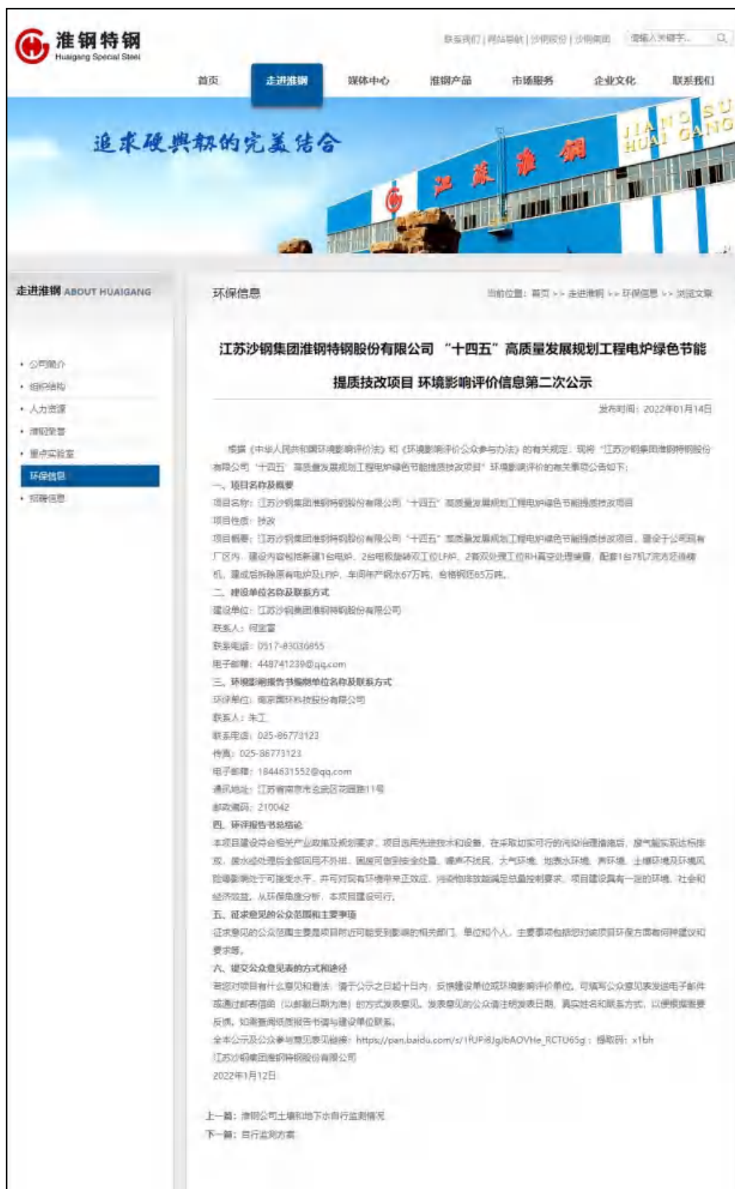
图 3.2-1 第二次网络公示截图