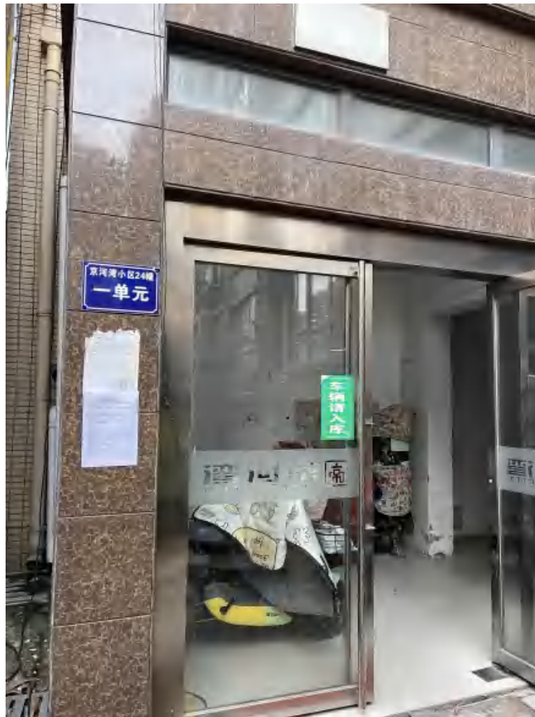
图 3.2-3 现场公告照片