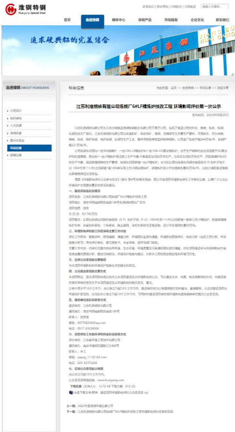
图 2.2-1 淮钢特钢网站第一次网络公示截图